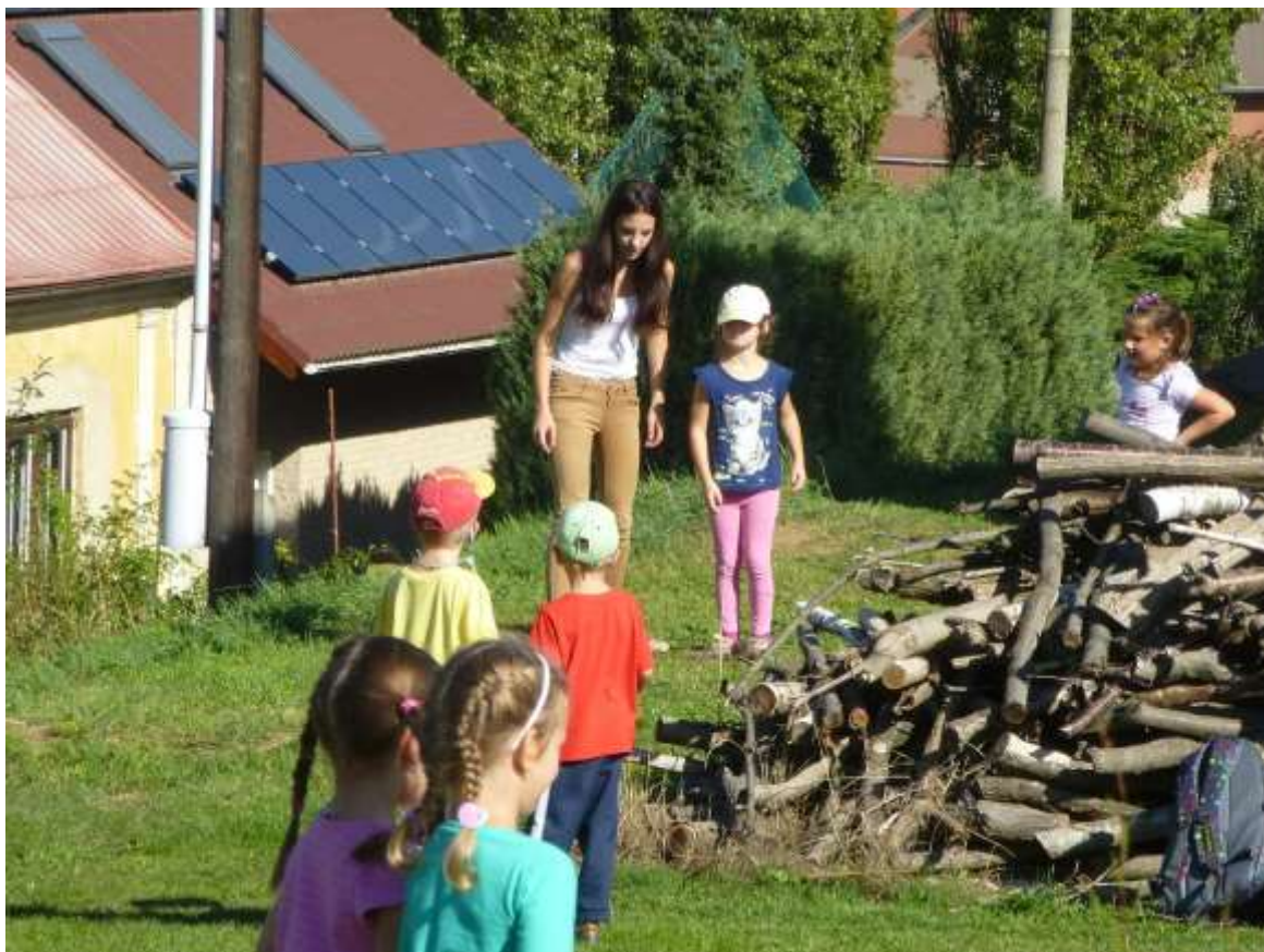
Přednáška „Vodní ptactvo“